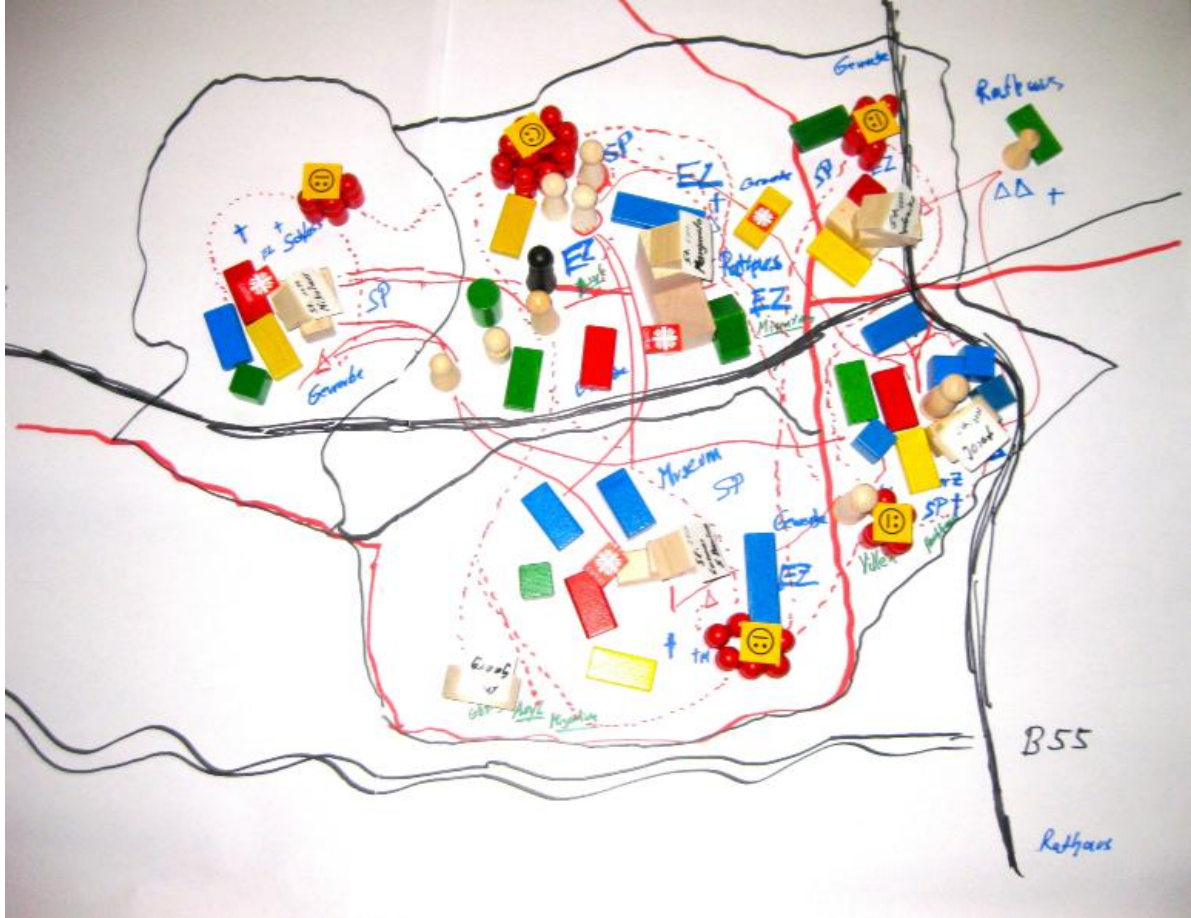
Planspiel „Der Gemeindecheck“ zur Analyse der Lebenswirklichkeiten und der Caritasarbeit in Gemeinden und Pfarreien